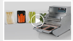
BS 5 ECO: Schalsiegelgerät für Spargel- und Gemüseverpackung